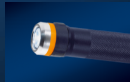
Suministros para talleres y protección laboral

DESPUÉS DE CREAR HERRAMIENTAS PERFECTAS, LO QUE MÁS NOS GUSTA ES SEGUIR PERFECCIONÁNDOLAS.