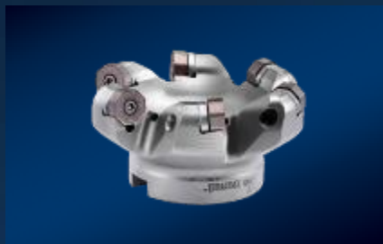
Arranque de viruta modular