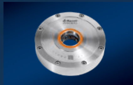
Técnica de sujeción