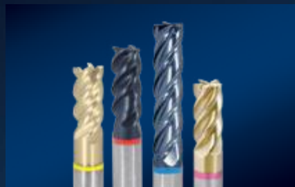
Monoarranque de viruta