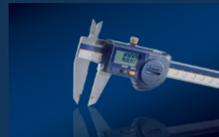
Técnica de medición