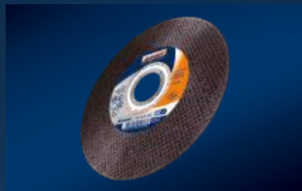
Técnica de rectificado y corte